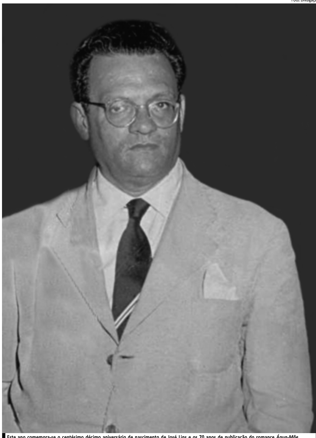
Este ano comemora-se o centésimo décimo aniversário de nascimento de José Lins e os 70 anos de publicação do romance Água-Mãe

Qualquer intérprete ou grupo da Paraíba pode se inscrever para o Festival Zé Lins Encenado. Quem optar por email deverá anexar a ficha de inscrição com todos os campos devidamente preenchidos. Encerrado o prazo, uma comissão - formada por profissionais da Funesc e da Secretaria da Cultura (Secult), sendo dois de artes cênicas e um de literatura - selecionará 30 propostas, de acordo com a estrutura técnica existente e disponibilizada para o evento. A Fundação Espaço Cultural, inclusive, conforme o edital,