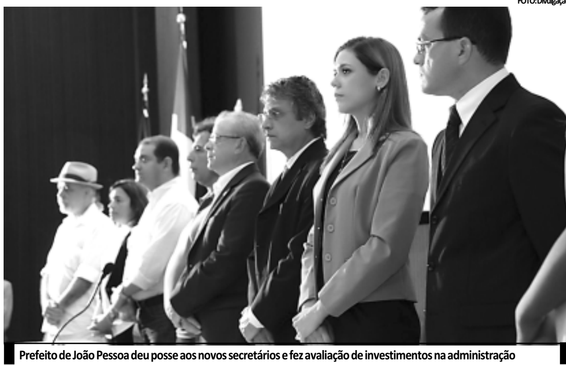
Prefeito de João Pessoa deu posse aos novos secretários e fez avaliação de investimentos na administração

O primeiro maior repasse foi em fevereiro e, em comparação com o mês de abril, o aumento é de 38,94% – valor bem acima da previsão mensal que era de 24% sobre o mês anterior. O levantamento indica a recuperação do Fundo nestes primeiros meses do ano. A estimativa da Secretaria da Receita Federal para maio era de R$ 6,5 bilhões em todo o Brasil. No entanto ao considerar este primeiro repasse, o mês terá um dos maiores repasses do ano.