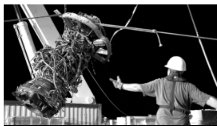
Uma das peças da aeronave da Air France, içada do fundo do mar

O navio francês La Capricieuse, enviado para recuperar as caixas-pretas a bordo do Ile de Sein, deverá chegar a Caiena, na Guiana Francesa, até amanhã pela manhã, diz o BEA. Em seguida, as caixas serão levadas a França por avião e deverão chegar apenas no dia seguinte em razão do longo trajeto e da diferença de fuso horário. O navio La Capricieuse chegou no sábado à área onde o Ile