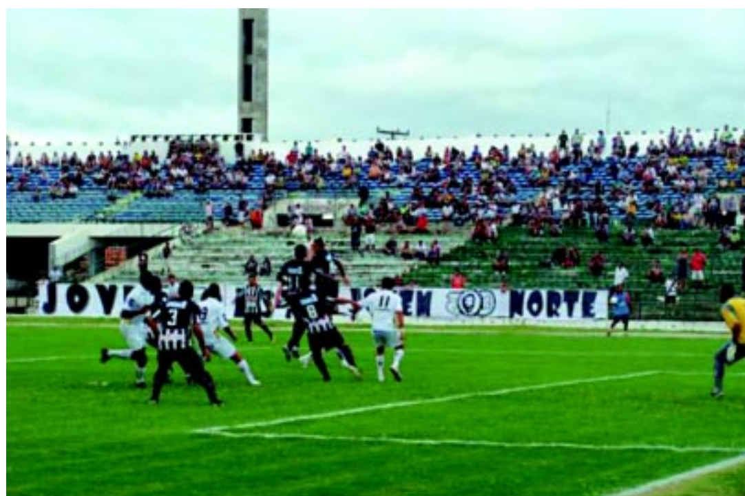
No clássico de Campina Grande, o Treze levou a melhor e a torcida vibrou com o resultado que garantiu a classificação

§ 5º Para os fins deste artigo, presume-se a intenção de impedir o prosseguimento quando o resultado da suspensão da partida, prova ou equivalente for mais favorável ao infrator do que ao adversário.