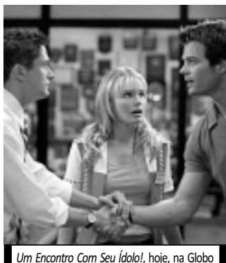
Um Encontro Com Seu Ídolo, hoje, na Globo