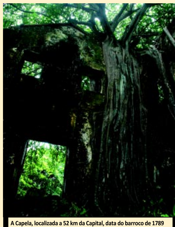
A Capela, localizada a 52 km da Capital, data do barroco de 1789

"Barroco Tardio, Barroco Tropical é a classificação utilizada para esse momento da arquitetura brasileira, embora que de região para região, de ordem para ordem religiosa, as mudanças de sítios tenham induzido a novas adaptações, por vezes novas linguagens", diz Gondim, autor do trabalho Gestão e Prática de Obras de Conservação do Patrimônio