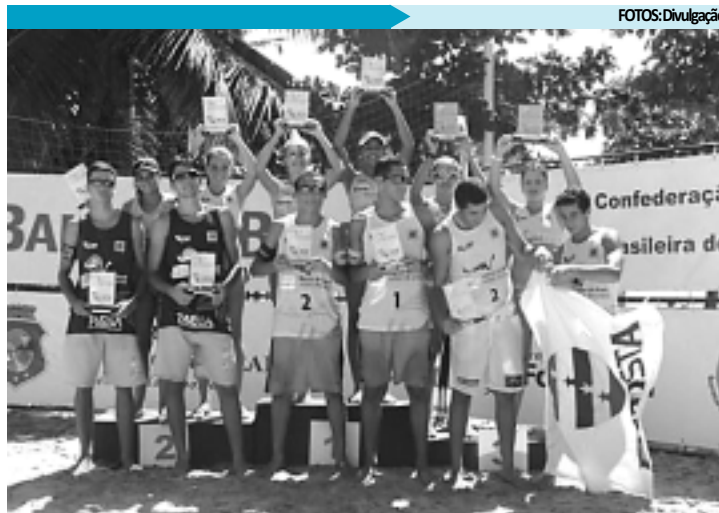
A Paraíba confirma que é um Estado formador de craques do vôlei

A nova geração do vôlei de praia paraibano deu mais uma prova de que promete arrasar nas arenas do país durante os próximos anos, mesmo que representem outros Estados.