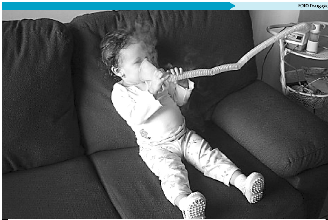
Os tipos mais comuns - rinite, asma, sinusite e bronquite - também atingem fortemente as crianças

Os especialistas explicam que em pessoas alérgicas o fungo ou a poeira são uma espécie de gatilho das reações. Quando elas respiram, inalam esses agentes e quando os fungos encontram uma situação favorável os alérgicos de-