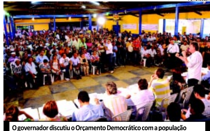
O governador discutiu o Orçamento Democrático com a população

Esses percentuais representam a participação de 663 pessoas na audiência, onde 473 foram reivindicações ligadas à saúde, 300 educação, 191 estrada e rodagem, 183 agricultura e 135, relativas a abastecimento d'água. Os pleitos da região surgiram durante a quarta audiência popular do Orçamento Democrático Estadual, cujo trabalho foi presidido pelo governador Ricardo Coutinho e