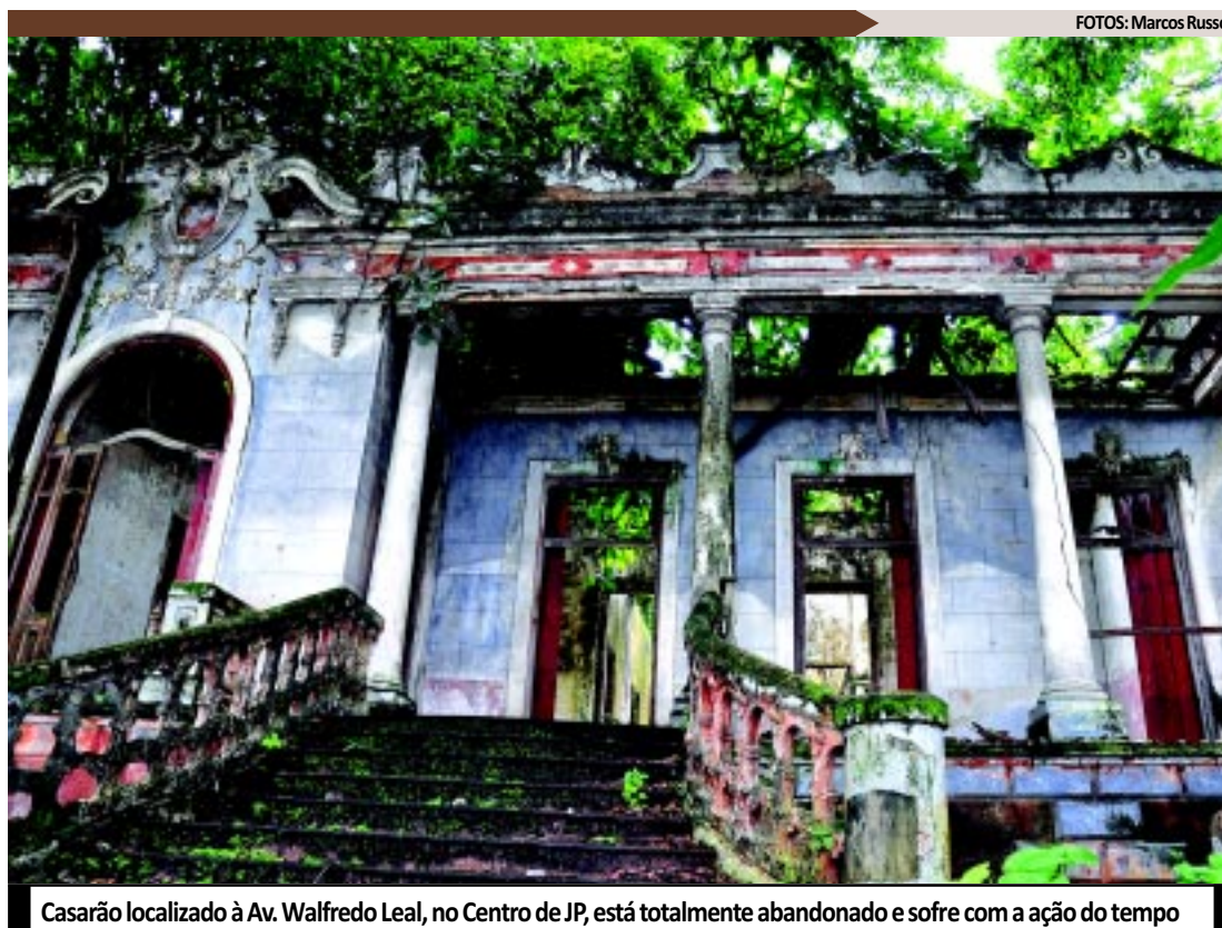
Casaarão localizado à Av. Walfredo Leal, no Centro de JP, está totalmente abandonado e sofre com a ação do tempo

A chefe de fiscalização do Iphaep lembrou que qualquer