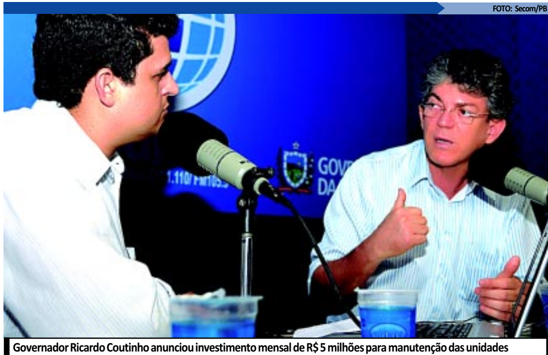
Governador Ricardo Coutinho anunciou investimento mensal de R$ 5 milhões para manutenção das unidades

HOSPITAL DE TRAUMA DE CAMPINA GRANDE - O governador Ricardo Coutinho também garantiu a inauguração do Hospital de Trauma de