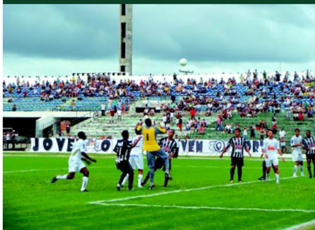
Lances do jogo decisivo de domingo passado no estádio Amigão entre Botafogo e Treze