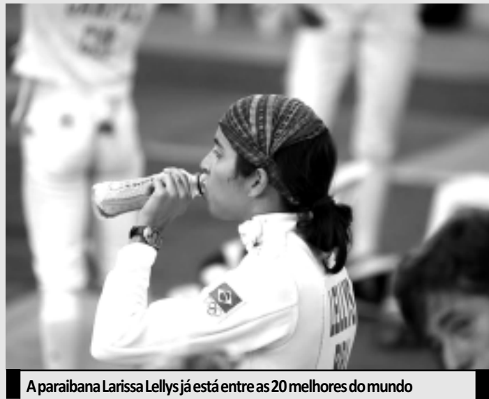
A paraibana Larissa Lellys já está entre as 20 melhores do mundo