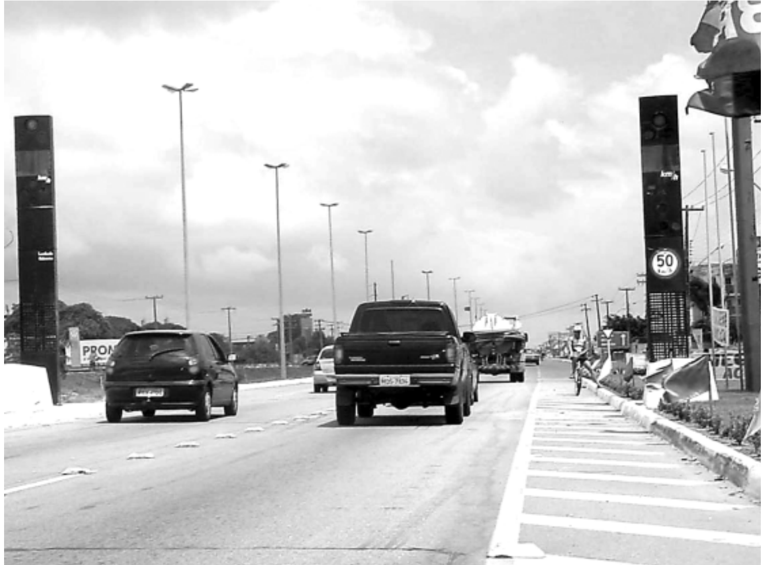
Além de melhorias estruturais, o projeto de restauração das vias federais que cortam a Paraíba conta com a instalação de 28 lombadas em 4 BRs

"Estamos sempre abertos ao diálogo com qualquer prefeito, de qualquer coligação. Nosso Governo não se atém às perseguições. O Governo serve para dialogar com as pessoas e promover o desenvolvimento. É por este caminho que vamos construir uma nova Paraíba", sinalizou o governador.